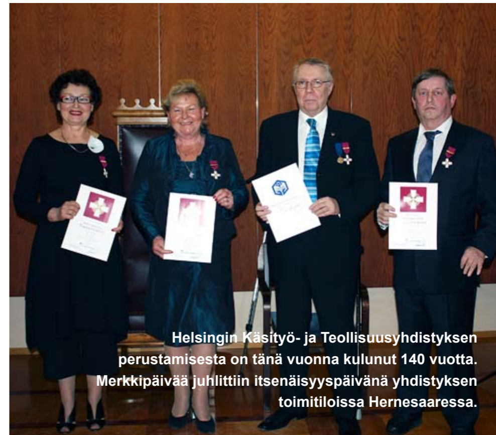
Helsingin Käsityö- ja Teollisuusyhdistyksen perustamisesta on tänä vuonna kulunut 140 vuotta. Merkkipäivää juhlittiin itsenäisyyspäivänä yhdistyksen toimitiloissa Hernesaassa.